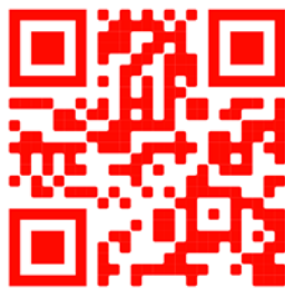
QR Code for Church bulletin, announcements