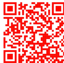
QR Code for YouTube Channel Sunday Worship